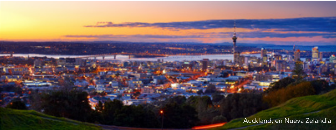
Auckland, en Nueva Zelanda

Número 17: Septiembre a noviembre de 2018